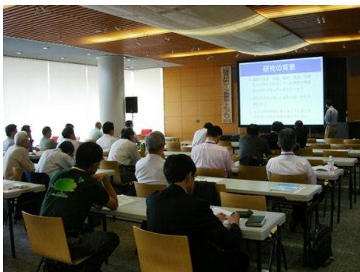
【発表会場（情報プラザ）の様子】

当日は、発表者・スタッフを除いて、83名の方に聴講いただきました。本発表会をきっかけとして企業と大学等との交流や、技術シーズの実用化に向けて発展することを期待します。